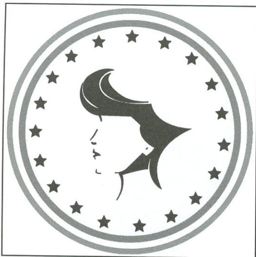
Logo creato in occasione della Mostra dalla Dottoressa Laura Cacchi, tirocinante presso la Biblioteca di interesse locale "Lorenzo Lodi".

con la prima mostra "Uomini in guerra per il 70° Anniversario della Liberazione, che è stata visitata dalle scuole elementari e medie e poi, con la giornata Mondiale della Donna, in occasione dell'8 marzo, ho voluto fortemente regalare a questo mio paese, la straordinaria Mostra itinerante "Donne decorate di Medaglia d'Oro al Valore Militare" che per la prima volta ha debuttato in Italia proprio qui, organizzata dalla sottoscritta con grande onore e soddisfazione!